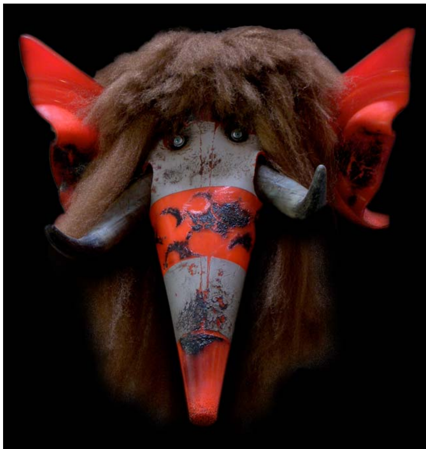
SONIA, mammoth de la mode Abattue par BIBI rue de Grenelle (cône de signalisation PVC)