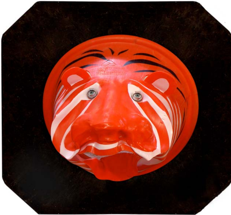
DANNY, tigre édenté Abattu par BIBI à la Sorbonne (cône de signalisation polyéthylène)