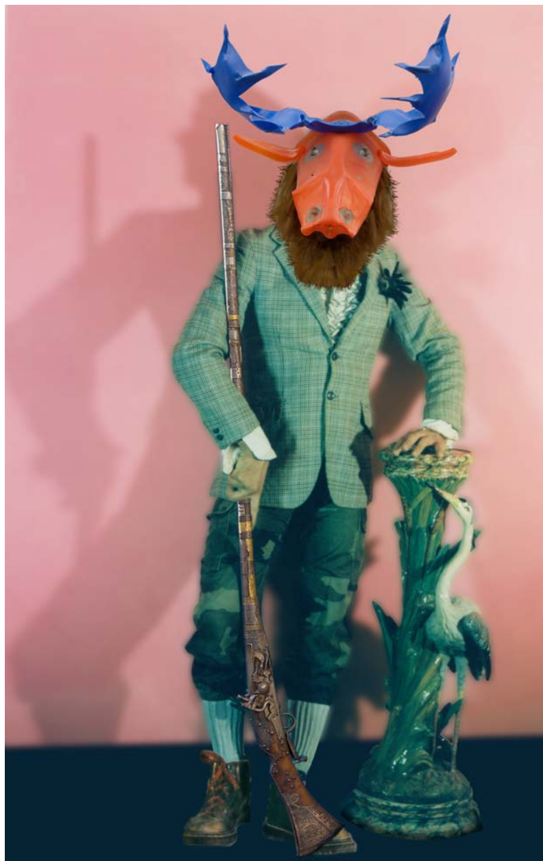
L'ombre du chasseur transparait derrière l'animal

Le communiqué de presse : www.bibi.fr/actu/bibi-cdp.pdf